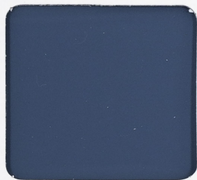
◆導電型ミラクフロアー 平滑工法 コーティング仕上げ Conductivity Type Flat