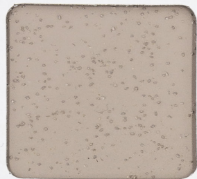
◆水性速硬型ミラクフロアー NS工法 防滑仕上げ(けい砂6号) Water Base NS